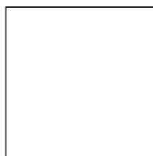
Matte white Blanco mate